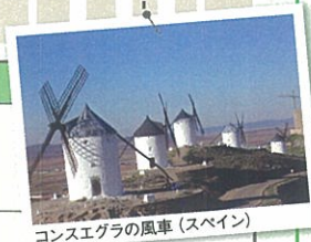
コンスエグラの風車 (スペイン)