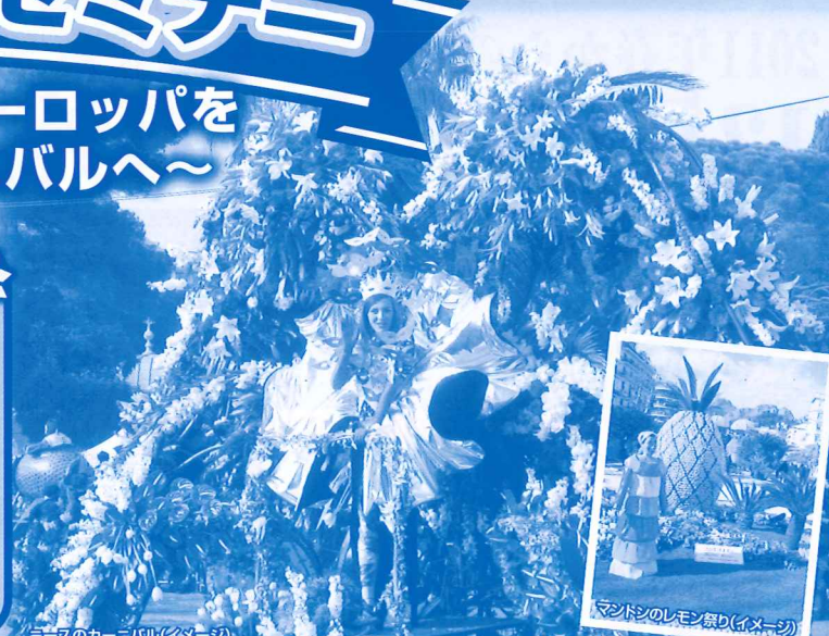
ドイツのカーニバル(イメージ)