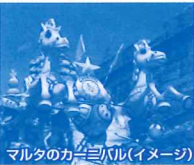
マルタのカーニバル(イメージ)